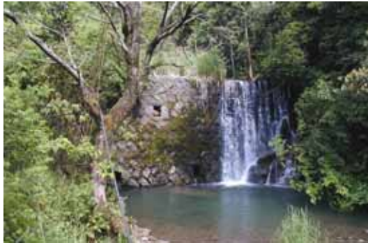
現況写真(カイツウ川)