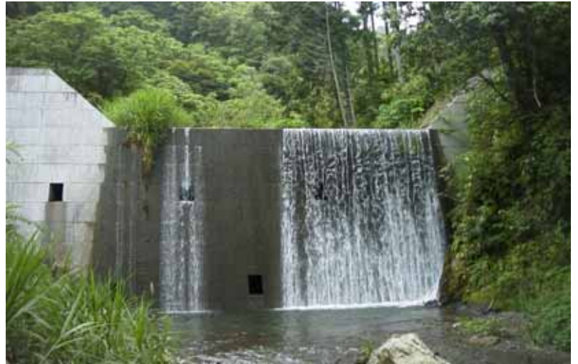
竣工写真(カイツウ川)

透過型砂防ダムとは、土石流を捕捉または土砂流出総量及びピークを調整し、かつ、溪流の水理的連続性を損なうことなく中小洪水を含む平常時に土砂を流下させることを可能にする開口部を持つ砂防ダムをいう。