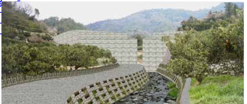
計画CG写真(口総大川)