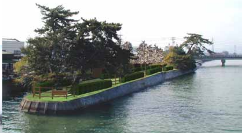
計画モンタージュ写真