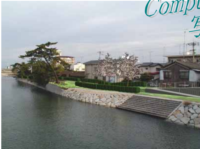
計画モンタージュ写真