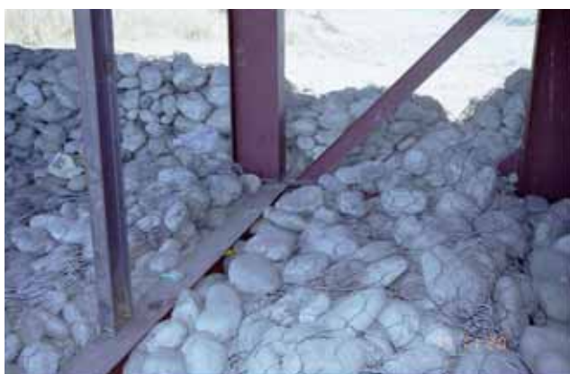
写真 - 9 仮栈橋の基礎の状況