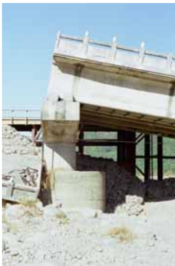
写真 - 4