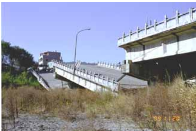
写真 - 2 被害全景(その2)