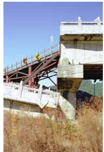
写真 - 5