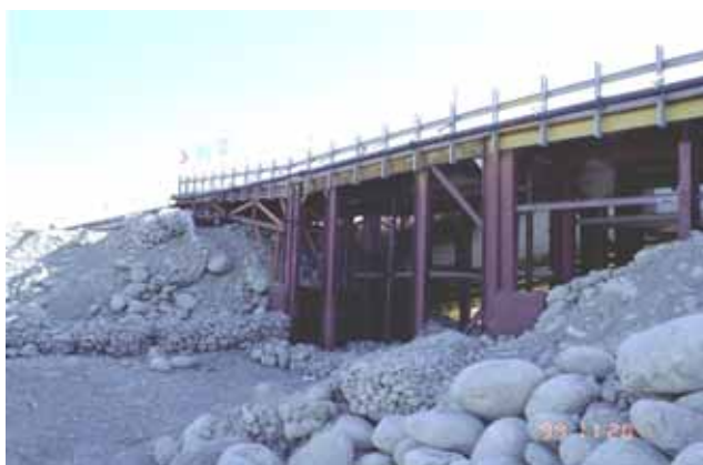
写真 - 8 応急復旧の状況