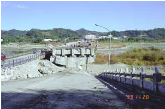
写真 - 1 被害全景(その1)