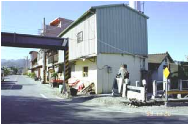
写真 - 6 周辺建物の状況

周辺の建物には大きな被害は見られない。 車両の通行制限(制限高さ3m)を行っている。