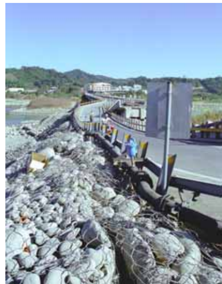
写真 - 7 ライフライン(水道管) の復旧状況

周辺の建物には大きな被害は見られない。 車両の通行制限(制限高さ3m)を行っている。